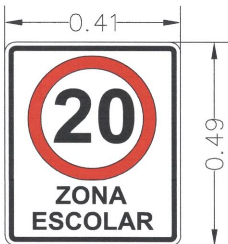
Cartel de velocidad máxima en zona de escuela