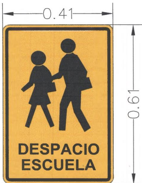
Cartel de aviso de escuela